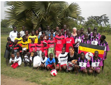
GHU Lira Familie

Die Kinder bereiten sich auf die grossen Ferien vor. Normalerweise dauern diese zwei Monate. Da die Wahlen auf Jahresanfang angesetzt sind, weiss niemand, wann die Ferien wirklich zu Ende sein werden. Meistens sind alle Schulen während den Wahlen und zum Teil auch danach geschlossen. So müssen wir uns auf ein langes Ferienprogramm einstellen und auch einen Vorrat an Wasser und Grundnahrungsmitteln anlegen.