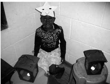
De Stärn vo Bethlehem

Die Augen der GHU Kinder strahlten bei dieser Geschichte etwas Ähnliches und sehr Starkes aus, gerade wie die in der Weihnachtsgeschichte dargestellten Hirten. Etwas wie eine Hoffnung, die ihnen nicht genommen werden kann.