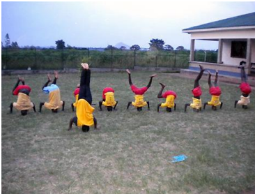
Lira Akrobatik Gruppe

Die Kinder vom GHU I (erster Teil des Projektes) schliessen ihre Ausbildungen nun ab und suchen Arbeitsstellen. Einige von ihnen machen ihre ersten beruflichen Schritte im GHU II in Lira.