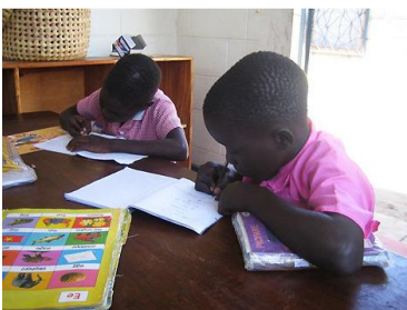
Nachhilfeunterricht bei GHU

Mit den Schulen haben wir teilweise eine gute Zusammenarbeit aufbauen können. Es ist nicht einfach, im ugandischen System den individuellen Bedürfnissen der traumatisierten Kinder gerecht zu werden. Wir unterstützen unsere Kinder mit Nachhilfeunterricht, der im Heim stattfindet. Im schulischen Bereich besteht grosser Handlungsbedarf. Auf allen Ebenen ringen wir um eine gute Lösung für die Kinder und für die Organisation, damit auch die Kosten tief bleiben.