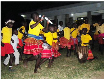
Tanzende GHU Kinder

Die Arbeit mit den verbleibenden Verwandten der Kinder haben wir weiter ausgebaut. Im letzten Jahr sind praktisch bei allen sechs Treffen 90 % dieser Vormunde erschienen. Meistens mit einem kleinen oder auch grossen Beitrag für alle Kinder, wie Sesam, Süsskartoffeln, Hühner und weitere Nahrungsmittel.