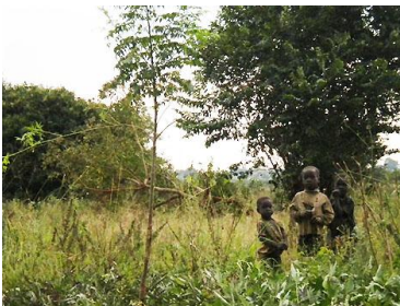
Wartende Freunde im Dorf

Mit traumatisierten Kindern zu arbeiten ist bereits eine grosse Herausforderung. Dazu kommen noch die ganz alltäglichen Probleme wie die Adoleszenz oder die Trotzphasen, die uns in der Entwicklung jedes Kindes begegnen. Auf dem Hintergrund der verwaisten jungen Menschen, die so oder so um ihre Identität kämpfen müssen, können solche Probleme ein noch grösseres Ausmass annehmen. Dies haben wir im Team während des letzten Quartals zu spüren bekommen und es hat uns sehr gefordert.