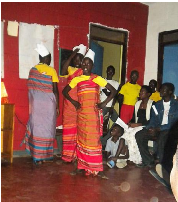
Die 3 Könige

Inzwischen wohnen bereits 33 Kinder im Kinderheim Lira. Bevor sie hierher kamen, mussten sie wegen des Bürgerkriegs unbeschreibliches Leid ertragen. Einige Kinder tragen sichtbare Verstümmelungen, andere innere Wunden mit sich herum.