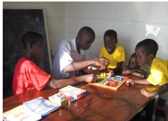
Stütz Unterricht in Lira bei GHUII