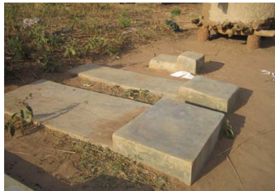
Ganze Familien werden durch Aids ausgelöscht