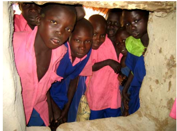
Dorfschule Kinder, die gespannt auf den Einsatz der Schweizer Volontäre warten

In diesen Sommer werden wir versuchsweise Besuch von zwei Gruppen von Freunden und Interessierten erhalten. Das Ziel dieser Aktivität ist es, Freunden und jungen Christen den Einblick in das Projekt, die Situation der Kinder in Afrika und die Schönheit von Uganda zu ermöglichen. Ebenso hoffe ich, dass durch den Austausch für beide Seiten, die Schweizerische und die Ugandische, eine Horizonterweiterung wie das Bewusstsein der weltweiten Familie Christi wachsen wird. Die heutige Zeit braucht weite, verständige Herzen. Dabei sind auch praktische Einsätze geplant wie Schulbänke herstellen, Spielplatz bauen und beim Quartalabschluss mithelfen. Weiter sind zwei Spiel-nachmittage geplant, ein Mal mit 600 Kindern in einer Dorfschule und das andere Mal im Lira Heim mit den GHU II Kindern und ihren Freunden.