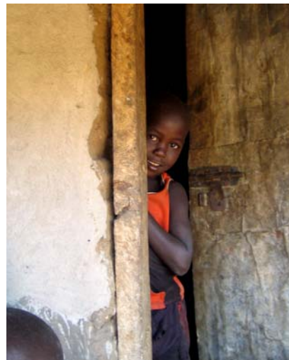
Was wird wohl die Zukunft bringen?