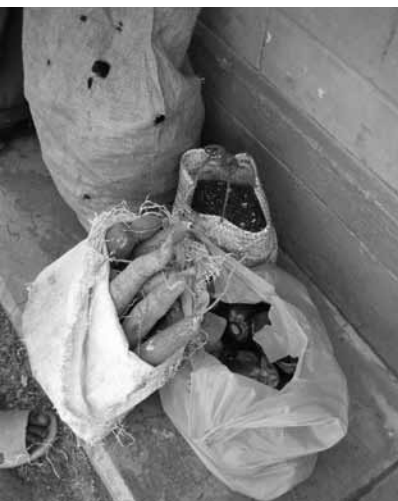
Die Gaben am Besuchstag.

Kontakt: God helps Uganda GHU, P. O. Box 654, Lira/ Uganda, info@godhelps-uganda.org