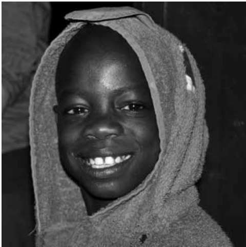
Peacemaker - frisch gebadet.