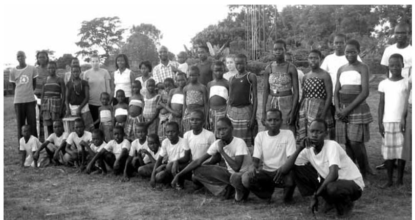
Die God helps Uganda-Familie. Peacemaker links aussen kniend.